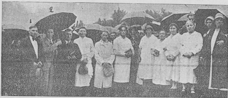
Keresztelés Brantfordban. (Canada).

Brantford. Urunk az Ő kegyelme által megengedte érniük ez év július hó 4-ikét amikor 7 lélek lett az Őr Jézus nevében alámerítve, akik nagyszámú hallgatóság előtt örömmel tettek valást, hogy, mint hívta ki őket. Isten a bűnös életből. S most boldog szívvel követik Mesterüket ez uton.